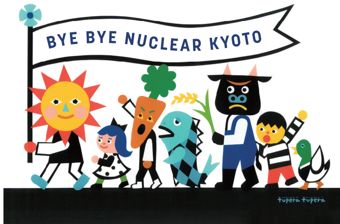
tupera tuperaさんが描いたバイバイ原発きょうとのイラスト