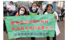
原発賠償京都訴訟原告団